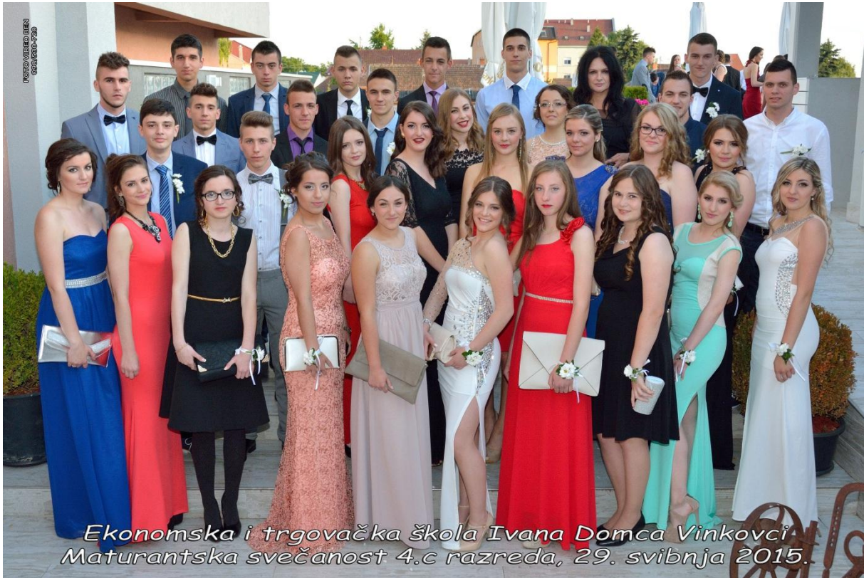
Ekonomska i trgovačka škola Ivana Domca Vinkovci Maturantska svečanost 4.c razreda, 29. svibnja 2015.