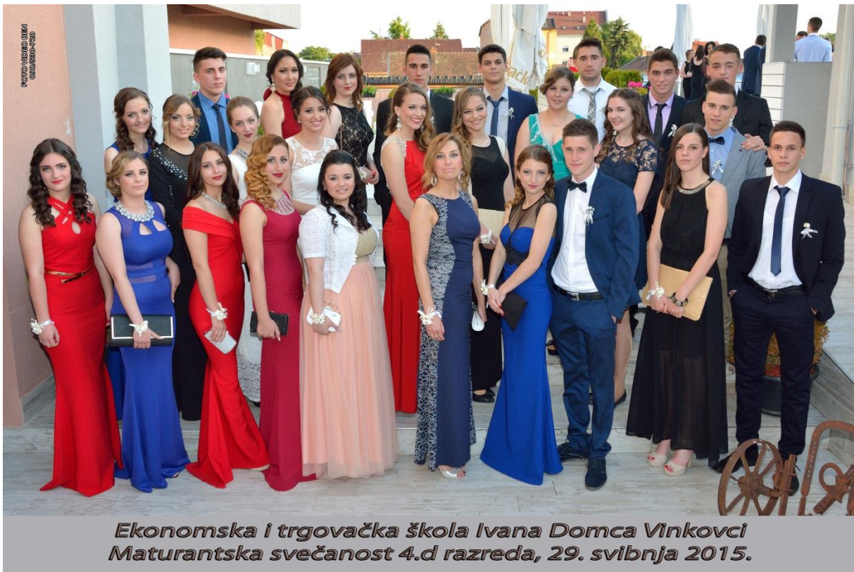
Ekonomska i trgovačka škola Ivana Domca Vinkovci Maturantska svečanost 4.d razreda, 29. svibnja 2015.