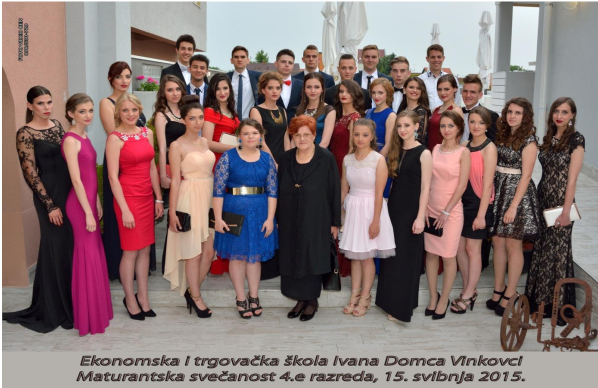
Ekonomska i trgovačka škola Ivana Domca Vinkovci Maturantska svečanost 4.e razreda, 15. svibnja 2015.

S ljubavlju gradite svoja gnijezda i mostove!